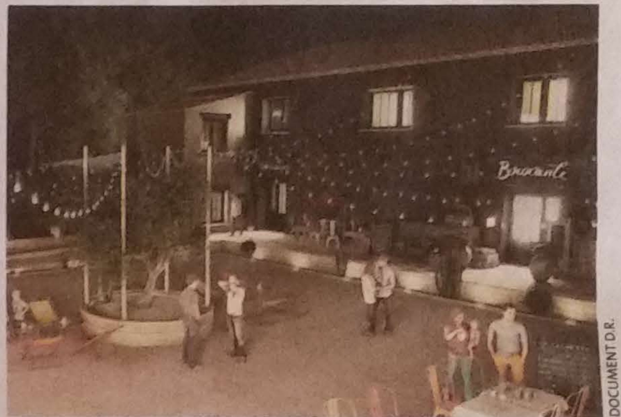
GUINGUETTE. Les fondateurs souhaitent imprégner les lieux de l'ambiance guinguette : lampions, nappes vichy et objets anciens occupent l'espace intérieur.