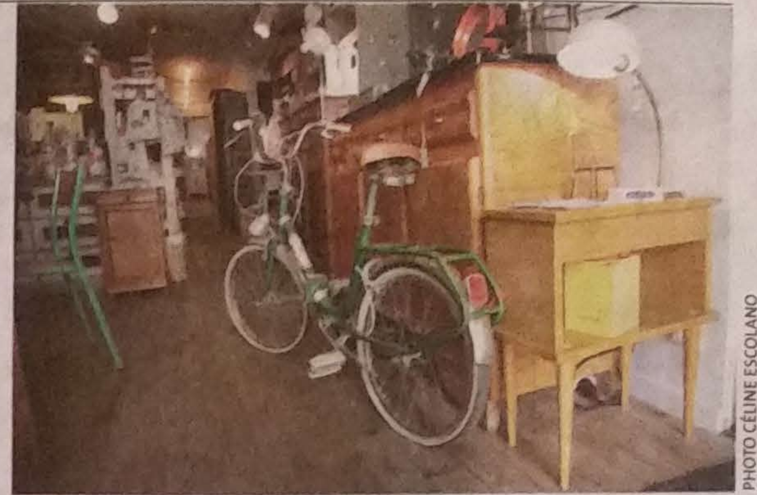
BROCANTE. L'espace brocante est occupé par des stands de professionnels locaux, comme ici Chic & Bohème qui gardera également sa boutique du quartier des Beaux-Arts.