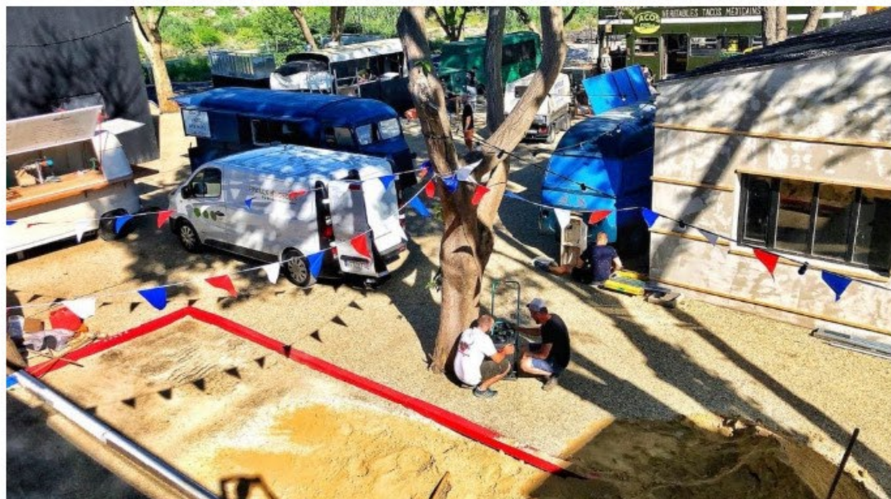
Derniers préparatifs avant l'ouverture ce jeudi à 19h

Les amateurs de cuisine de rue se donnent rendez-vous ce jeudi à 19h au marché du Lez pour l'ouverture du nouvel espace Street Food. Huit foodtrucks y proposeront désormais leurs plats à base de produits bios et locaux à partager entre amis, familles, collègues de bureau... au déjeuner, à l'apéro ou au dîner. Deux concept-trucks permettront de chiner objets et vêtements dans un espace promis à la détente et à la convivialité.